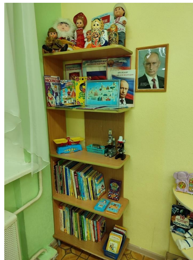
ПАТРИОТИЧЕСКИЙ УГОЛОК / КНИЖНАЯ ПОЛКА / УГОЛОК ЭКСПЕРИМЕНТИРОВАНИЯ