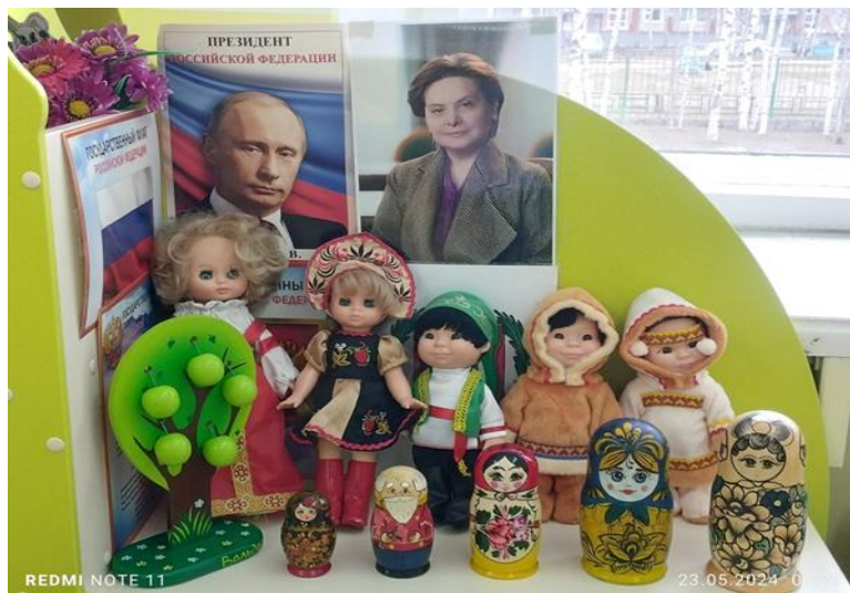
Центр нравственно-патриотического воспитания «Ребенок и культура»