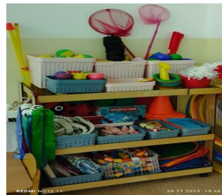
Центр двигательной активности и Центр здоровья