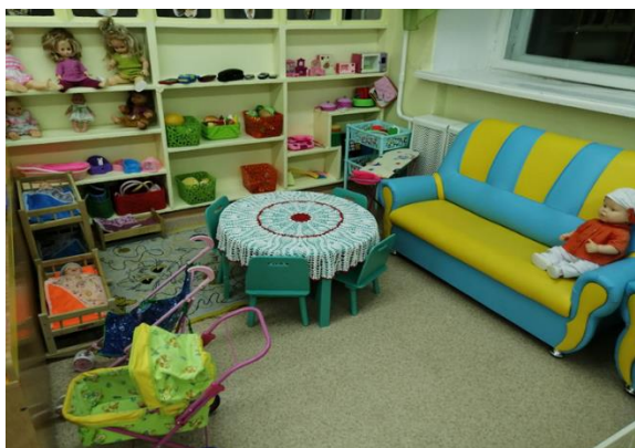
Центр сюжетно-ролевых игр для девочек