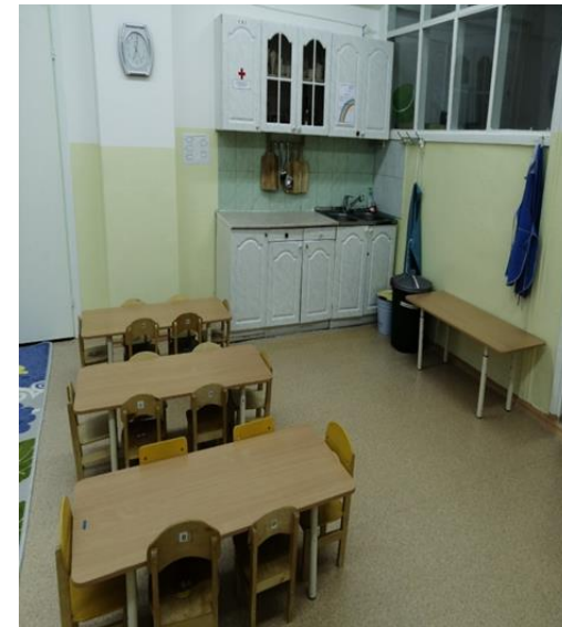
Зона приема пищи