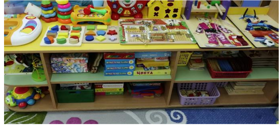
Центр сенсорного развития