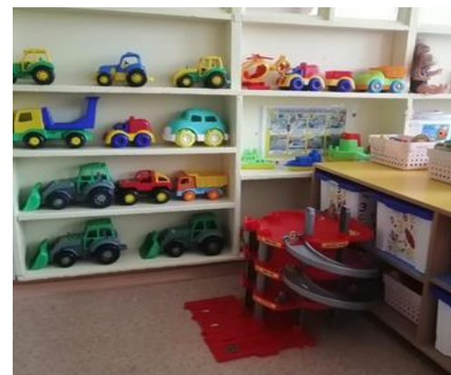
Центр сюжетно-ролевых игр для мальчиков