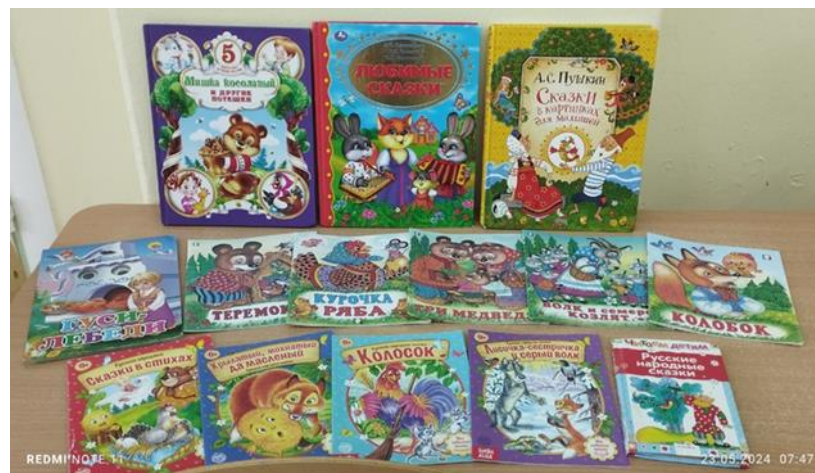
Центр детской книги